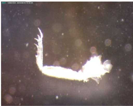
Mynd 2. Fjórði leggurinn var notaður í tegundagreiningu. (Nave)