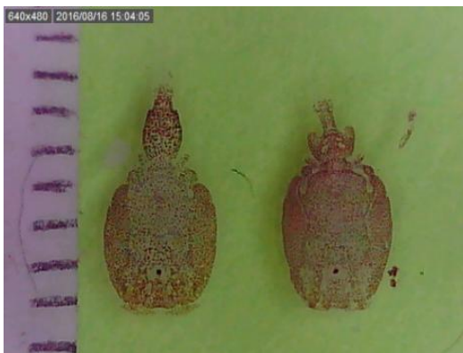
Mynd 3. Hreyfanlegar lýs fundust á regnbogasilungi í Haukadalsbotn 16. ágúst 2016 í kví Hb 5. (Nave)