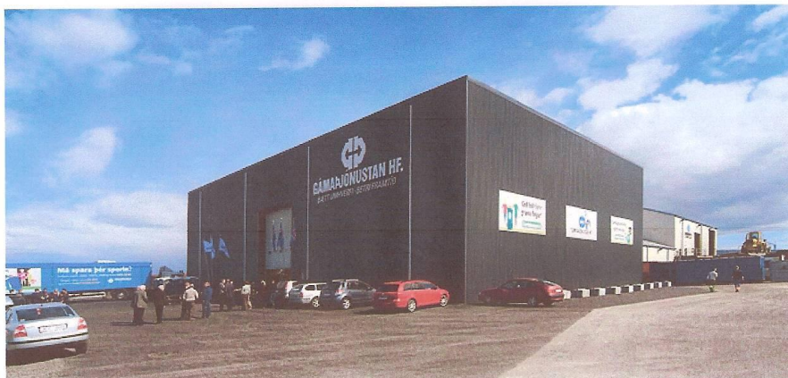
Mynd 1. Móttöku- og flokkunarstöð Gámaþjónustunnar hf Berghellu Hafnarfirði (júni 2010)

Efni bréfs: Tilkyning Skipulagsstofnunar um jarðgerð Gámaþjónustunnar við Berghellu 1, Hafnarfirði í samræmi við j-lið 11.tl 2. í viðauka við lög nr. 106/2000