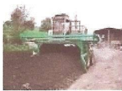
Mynd 7. Moltumúgavél

Nú í byrjun apríl 2010 hefur orðið að ráði að eftirmeðferðin verði flutt til Keflavíkur nánar tiltekið til gamla Pattersonflugvallar en þar hafa samtökin „Gróður fyrir fólk í landnámi Ingólfs“ verið með jarðgerð. Þetta er gert til að tryggja að nægjanleg loftun verði í efninu. Þar verður efninu snúið með sérhæftri moltumúgavél sem er í eigu Gámaþjónustunnar hf. Leyfi frá Heilbrigðiseftirliti Suðurnesja hefur fengist fyrir þessari breytingu.