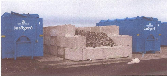
Mynd 6. Jarðgerðargámar og bíofilter við Berghellu

frá gámunum í þessu ferli er leitt í setpró þar sem föst efni setjast til botns en hreint vatn fer í jarðveginn eins og raunar allt regnvatn á svæðinu. Innblæstri lofts og útsogi er stjórnað miðlægt í iðnaðartölvu. Hiti er mældur reglulega og teiknast upp á graf á móti tíma. Miðað er við að hitinn sé 65-70°C í amk tvo daga og er haft eftirlit með því að svo sé raunin.