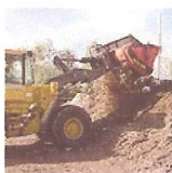
Mynd 5. Allu-skófla

Hingað til hefur efnið lífræna efnið verið lagt út á 20-40 cm þykkt timburflísarlag sem komið er fyrir á malbikaða planinu. Efnið hefur síðan verið hulið með timburflís