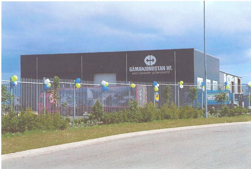
Mynd 3. Lóðamörk Gámaþjónustunnar við Berghellu. Myndin er tekin á 25 ára afmæli Gámaþjónustunnar hf í júní 2010.

Fullyrða má að frágangur á öllum ytri lóðamörkum fyrirtækja Gámaþjónustunnar hf í iðnaðarhverfinu í Helluhrauni Hafnarfirði sé samkvæmt lóðaskilmálum (girðing trjágróður o s frv) sem er meira en hægt er að segja um ýmsa aðila á svæðinu.