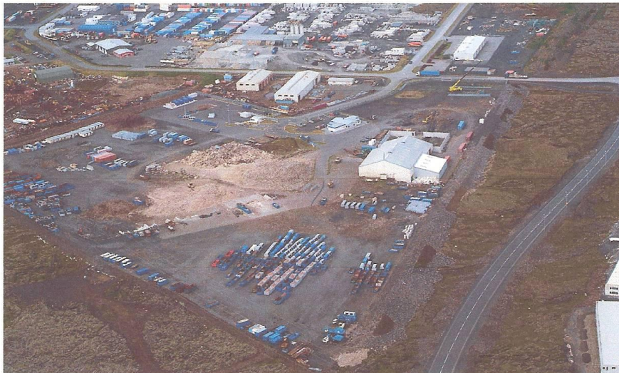
Mynd 2. Athafnasvæði Gámapjónustunnar hf Berghellu Hafnarfirði á skipulagssvæði fyrir grófasta iðnað B3. (okt 2008)

Athafnasvæðið við Berghellu var síðan stækkað með lóðaúthlutun frá Hafnarfjarðarbæ og er nú alls rúmlega 7 ha.