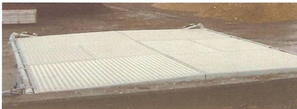
Mynd 4. Hið nýja síló. Séð ofanfrá.

Þessa dagana er verið að koma hinu nýja síló fyrir. Það mun auðvelda geymslu og meðhöndlun lífræna úrgangsins áður en til blöndunar kemur.