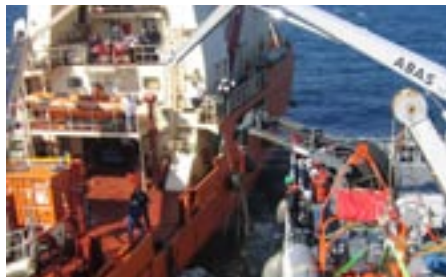
Emergency lightering can be part of a regional exercise.