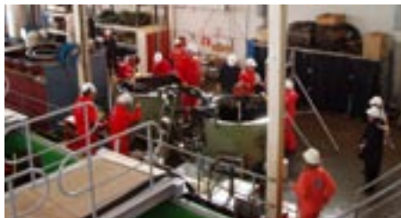
Having the equipment certified and to develop the equipment for e.g. response to high density oil, tests are made with available equipment.

uppföljning av utvecklingen för användning av kemiska och biologiska bekämpningsmetoder och certifiering av utrustningar samt utveckling av utrustning för bekämpning av högviskösa oljor och av olja i is.