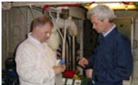
Workshops and exchanging experiences e.g. oil sampling at sea is performed.

I avtalet står det även att länderna alltid ska sträva efter att förbättra samarbetet genom planering och övningar.