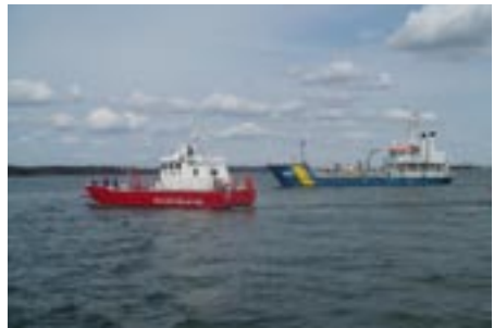
Cooperation in response to oil at sea.

Det regionala samarbetet mellan de nordiska länderna har vidareutvecklats genom tillägg av bi- och trilaterala avtal. Övningarnas syfte är att testa larmvägar, kommunikation och utrustningar vid eventuella utsläpp som berör mer än ett land.