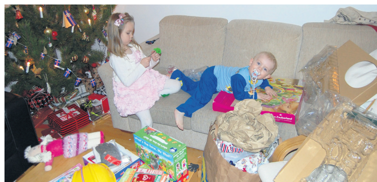
Á jólnum fellur til heilmikill úrgangur.

Kominn er tími til að biðla til æðri máttarvalda um aðstoð við að kveða endanlega niður það-ferallt-í-sömu-holuna drauginn, þann lífseiga púka. Stundum hafa komist á kreik sögur um að það sé ekki til neins að flokka úrgang því hann endi hvort sem er allur í sömu holunni. Það er þó engan veginn rétt að halda slíku fram. Í dag er alþjóðlegur markaður fyrir endurvinnsluúrgang sem íslensk fyrirtæki og sveitarfélög hafa aðgang að. Auk þess er bannað að urða suma úrgangsflokka og mikil pressa á að draga úr urðun lífræns