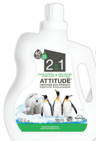
þvottaefni og mýkingarefni