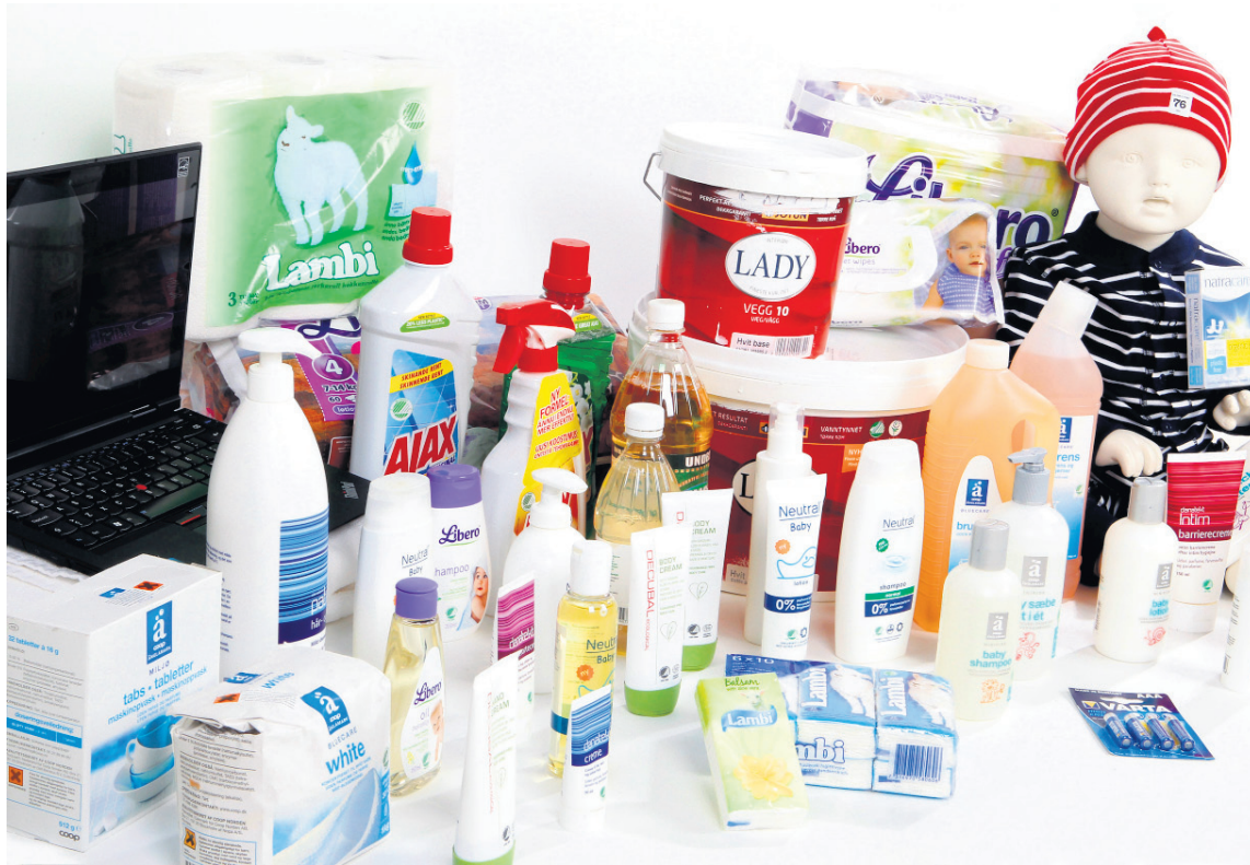
Úrvalið af Svansmerktum vörum er mjög fjölbreytt.

Svanurinn hefur þróað kröfur fyrir meira en 60 mismunandi vöru- og þjónustuflokka, allt frá hreinsiefnum og hjólbörðum til hótela og prentsmíðja. Kröfurnar ná ávallt yfir allan lífsferil vörunnar, allt frá hráefnum yfir í framleiðsluferlið, notkun og úrgang. Til að mynda þarf viður í Svansmerktum vörum að vera úr sjálfbærri ræktun, lágmarka þarf orkunotkun við framleiðslu, notk-