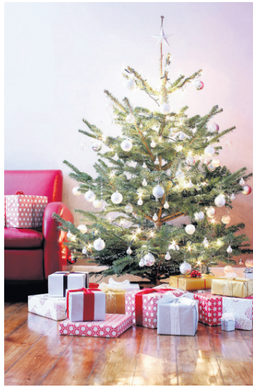
Jólunum fylgja mikil innkaup og þá er um að gera að velja rétt.