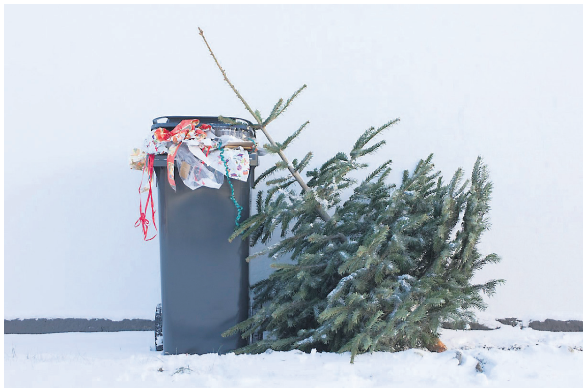
Úrgangur er ekkert annað en hráefni sem við þurfum ekki lengur á að halda og mætti því kalla afgangsráefni.