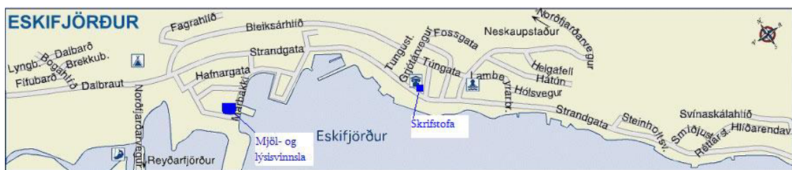
Mynd 1 Yfirlitsmynd af Eskifirði

Mjöl- og lýsisvinnsla Eskju er staðsett á Marbakka sem er iðnaðarsvæði á Eskifirði og skrifstofa fyrirtækisins er staðsett í miðjum bænum líkt og mynd 1 sýnir.