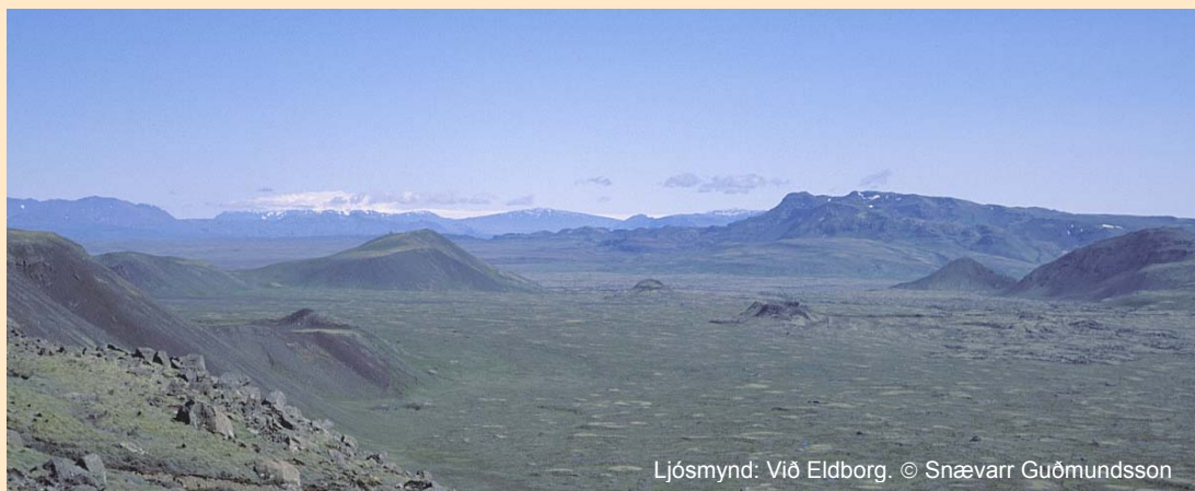
Ljósmynd: Við Eldborg.

Brýnt er að stöðva alla efnistöku á svæðinu og lagt er til að gert verði við skemmdir þær sem unnar hafa verið á Eldborg.