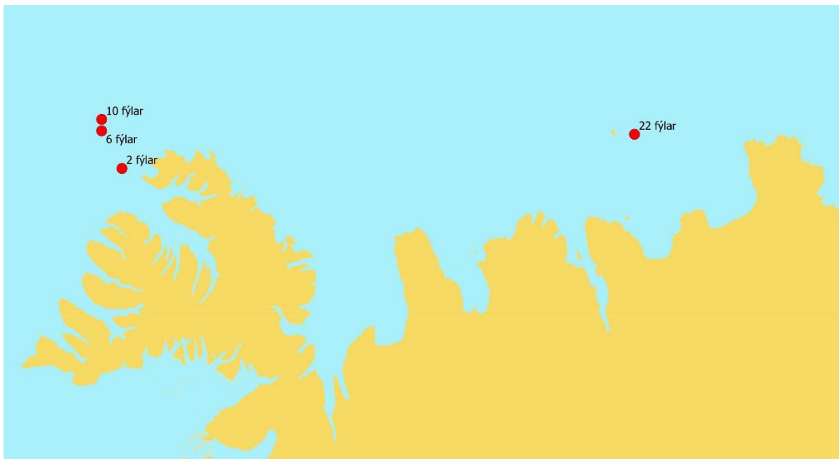
1. mynd. Söfnunarstaðir fýla við Ísland vorið 2018 og fjöldi á hverjum stað.

Plast fannst í um 70% fýla og var það hlutfall svipað eftir því frá hvoru svæðinu fýlarnir komu. Um 16% þeirra voru með meira en 0,1 g af plasti, 14% fýla frá Vestfjörðum og 18% frá Norðausturlandi. Meðalfjöldi plastagna í meltingarvegi fýlanna var 3,65 og meðalþyngdin var 0,0486 g. Fýlar frá Vestfjörðum voru að meðaltali með fleiri plastagnir í sér, 4,67 á móti 2,68 frá Norðausturlandi. Stafar þessi munur af tveimur fuglum frá Vestfjörðum sem voru með óvenju margar plastagnir í sér eða 28 hvor. Mesti fjöldi plastagna í fýl frá Norðausturlandi var 10. Meðalþyngd plasts í fýlunum frá Norðausturlandi var 0,0518 g, aðeins hærri en frá Vestfjörðum, 0,0452 g (2. tafla).