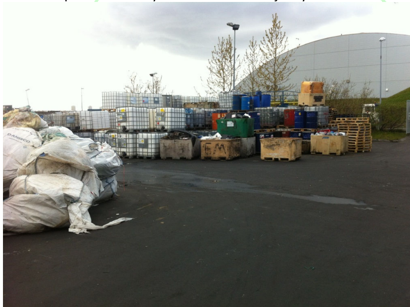
1 Geymslusvæði Efnamóttökunnar hf.

Á geymslusvæði fyrirtækisins, sem er utandyra, eru allt að 20 rúmmetrar af óunnum efnum sem geymd eru í 1000L flutningstönkum. Tankarnir eru allir UN 31 HA1/Y merktir sem þýðir að tankurinn fullnægi kröfum og er vottaður skv. flutningareglum IMO og ADR fyrir hættulegan varning, viðhengi #1 Tankar. IMO reglurnar ná yfir sjóflutninga og ADR yfir landflutninga. Slíkir tankar eru þéttir og hannaðir þannig að þeir þola verulegt hjask og farg áður en þeir leka. Uppgufun frá þeim er því ekki til staðar ef þeir eru rétt lokaðir og frágangur í lagi. Tankarnir eru sóttir til Efnamóttökunnar í Reykjavík þar sem efnunum er safnað á tankana. Þar er áralöng reynsla af slíkri notkun við eins aðstæður í margfalt meira mæli. Einnig eru þar iðulega 3-10 söfnunartankar opnir að staðaldri sem verið er að safna í án þess að valda lyktarvandamálum. Sjá mynd.