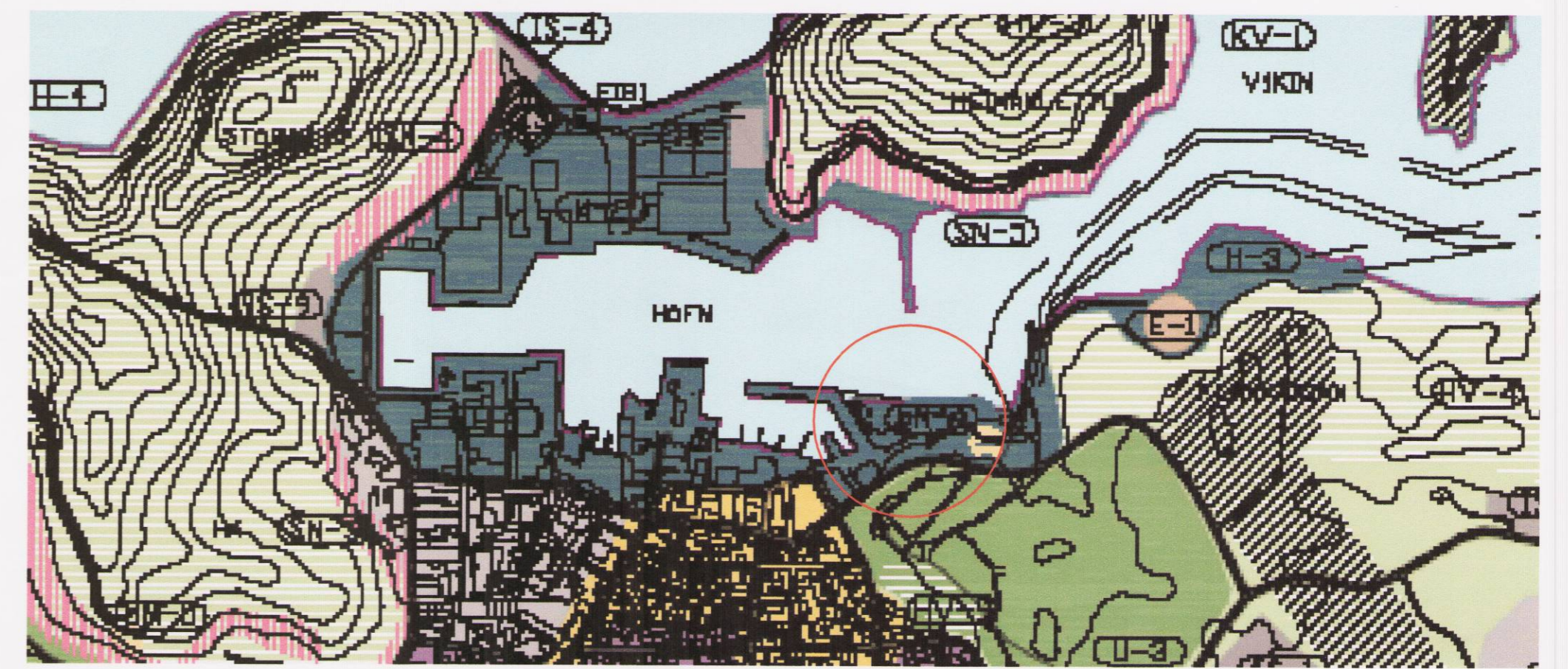
AÐALSKIPULAG VESTMANNAEYJA 2002-2014