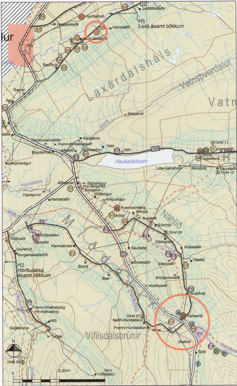
Breyttur aðalskipulagsuppráttur í mkv. 1:100.000.