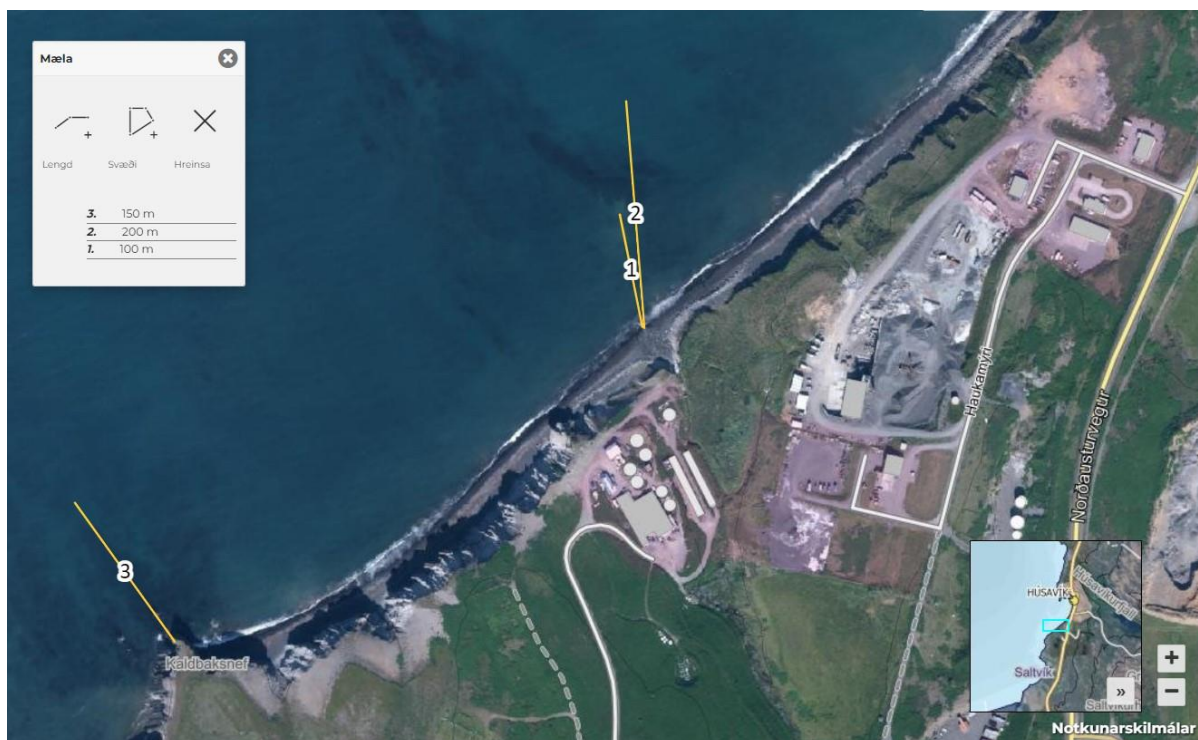
Mynd 3. Sýnatökustaðir við útrás frárennslis ( 1 og 2 ) og viðmiðunarstaður ( 3 ).

Sýni vegna eftirlits á strandhloti verða tekin út frá útrás landeldisstöðvarinnar í ca. 100 m og 200 m fjarlægð, mælt frá neðri mörkum stórstraumsfjörumörkum auk viðmiðunarsýnis sem tekið er utan áhrifasvæðis eldisins (mynd 3).