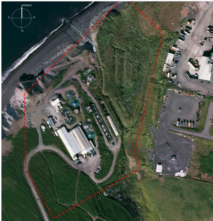
Mynd 1: Yfirlitsmynd yfir athafnasvæði Fiskeldisins Haukamýri.

Staðsetning eldis laxfiska, slátrunar og vinnslu Fiskeldisins Haukamýri ehf. er á Haukamýri á Húsavík (mynd 1).