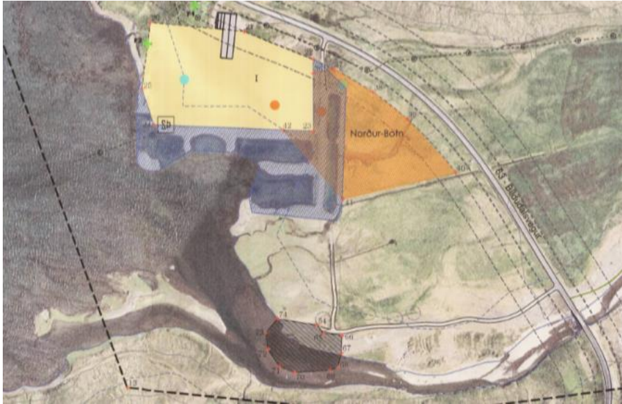
Mynd 1. Eldissvæði Arctic Smolt í Norðurbotni í Tálknafirði.