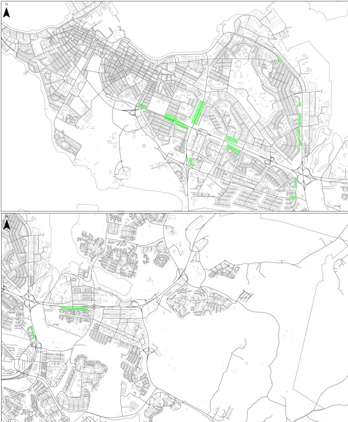
Mynd 2 og 3. Svæði í forgangi

Horft er til svæða þar sem umferðarhávaði veldur íbúum verulegu ónæði og reiknast yfir L_{den} = 68 dB, t.d. á stöðum þar sem byggð er í nágrenni við stofnbrautir. Á þeim svæðum verða skoðaðar mögulegar hljóðvarnir eða lagfæringar á þegar byggðum hljóðvörnum. Áhersla verður lögð á að bæta hljóðstig á íbúðalóðum.